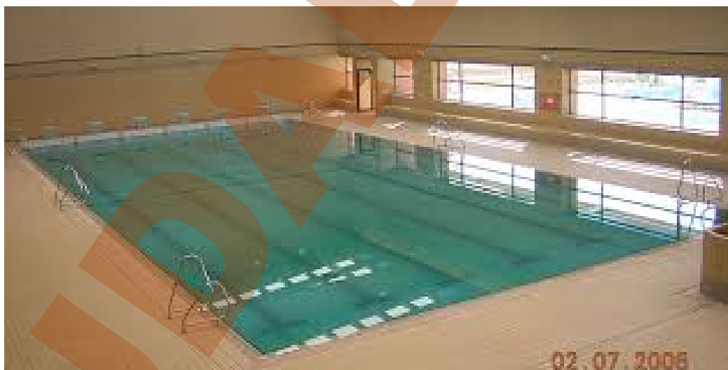
Piscina cubierta de La Fortuna.

Toda la gestión y actividades que se realizan en dicha instalación están en manos de la contrata.