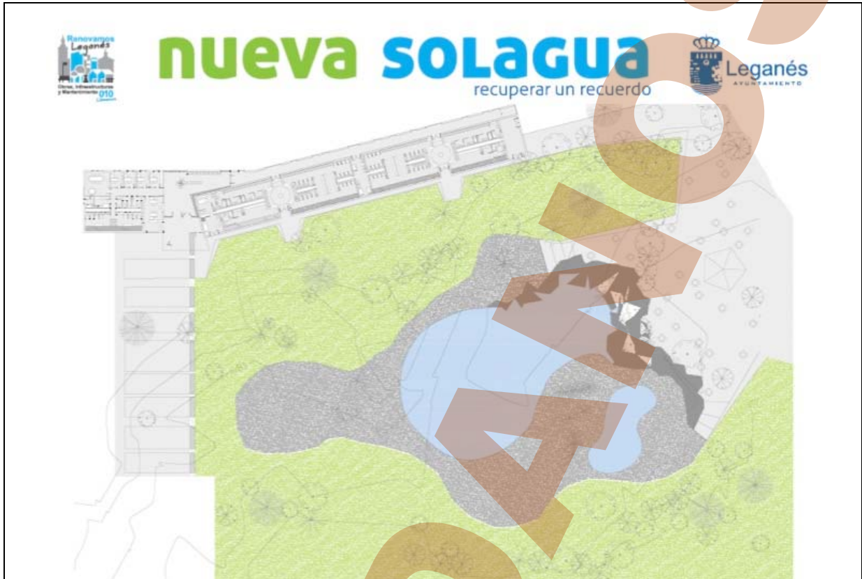
Nuevo proyecto del PP