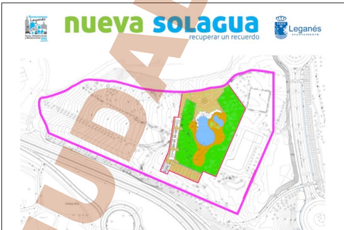
Nuevo proyecto del PP