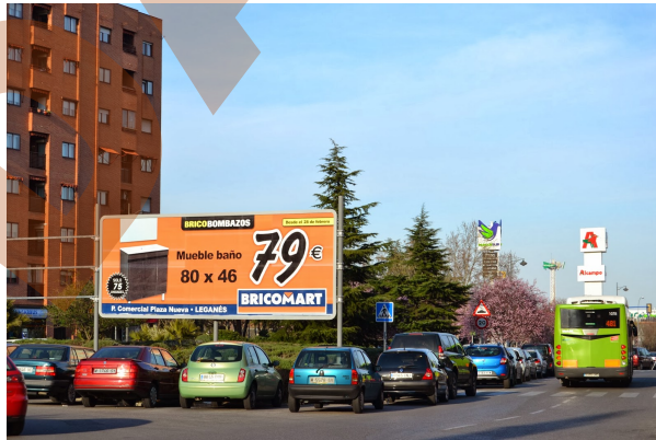
Foto: Glorieta Derechos Humanos en Avda. Juan Carlos I. Leganés Activo

Más de un centenar de vallas publicitarias como consecuencia de esta adjudicación inundan rotondas, parques y zonas urbanas de la ciudad.