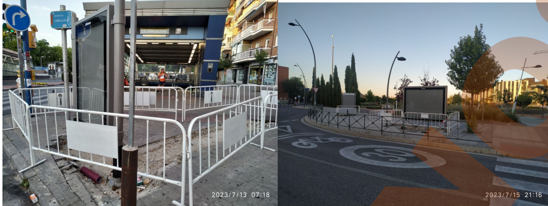
Imágenes de chirimbolos conectados a la red de alumbrado público.