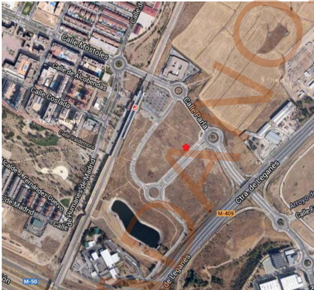
Parcela donde está ubicado el colegio público Antanes

Las imágenes nos indican que la parcela está a mucha distancia de la zona residencial más próxima, con lo cual los únicos niños que se van a beneficiar de dicha instalación serán los que acudan a dicho centro. Por tanto, esta instalación infantil no va a servir para el disfrute de los niños del barrio, ya que las viviendas más cercanas están a 600 m.