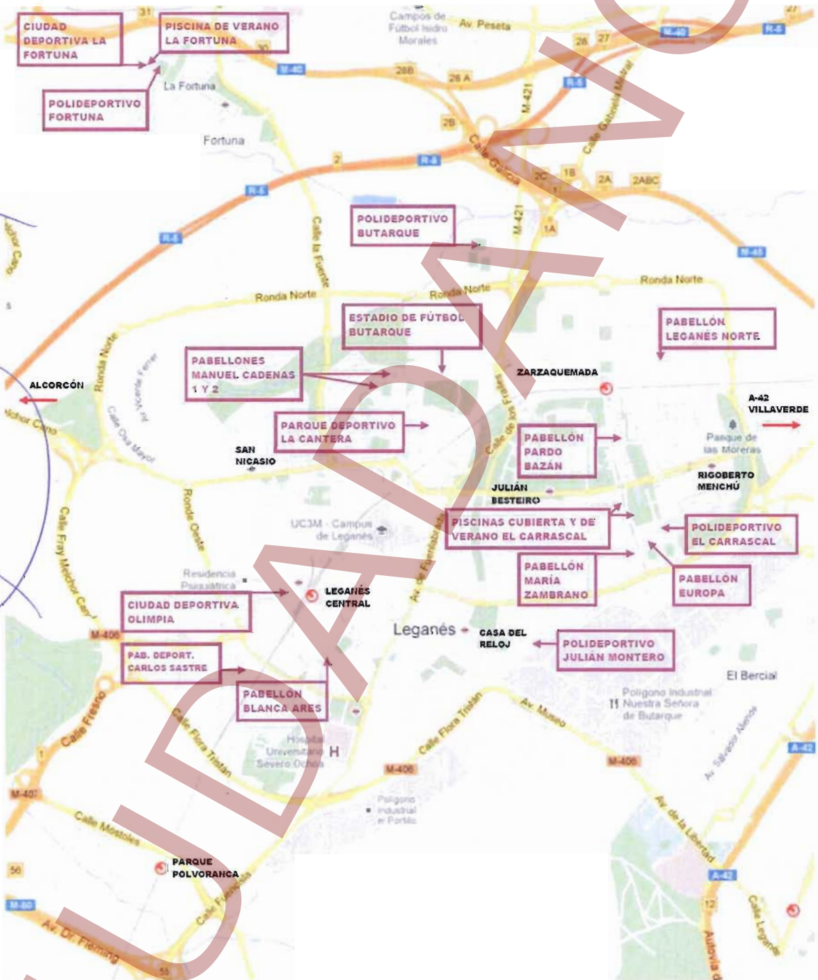
Plano de instalaciones deportivas de Leganés.